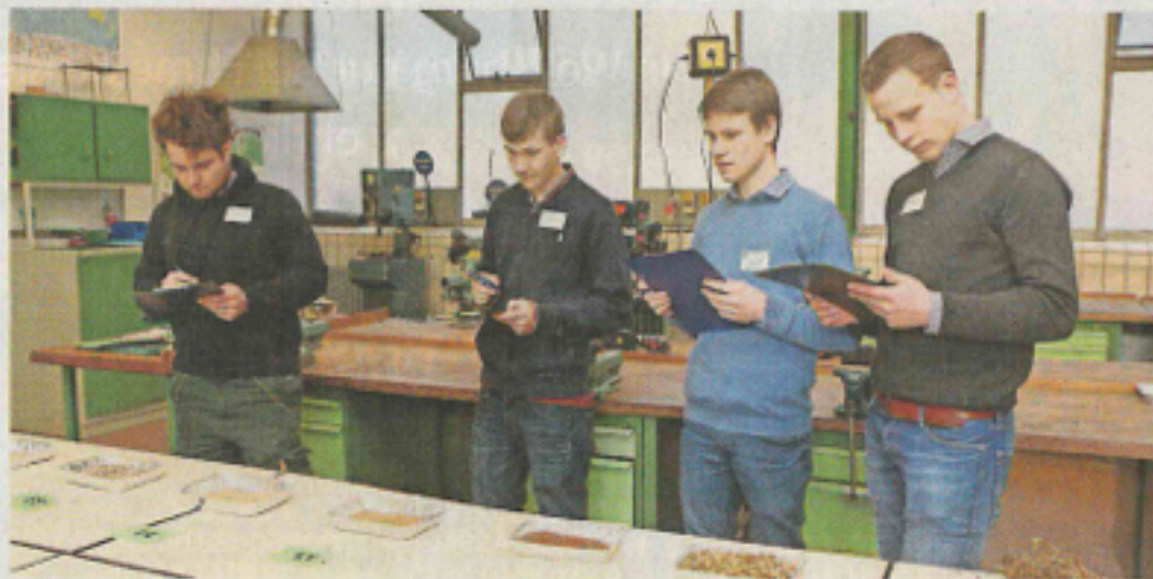
Fachwissen gefragt: 54 zukünftige Landwirte waren beim BBS-I-Berufswettbewerb mit dabei.