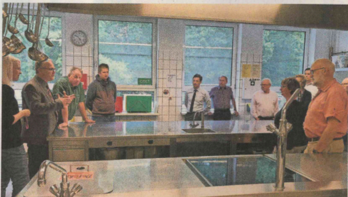
Ortsbesuch der SPD: Die Politiker schauten sich in der Gifhorer BBS 1 um.