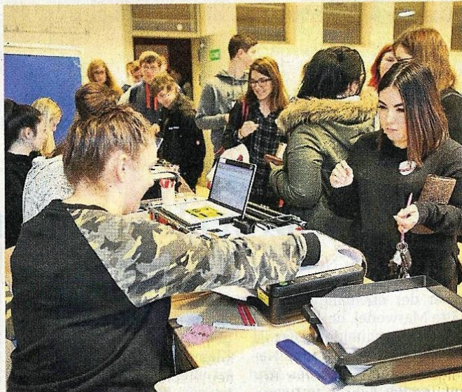
Lange Schlange an der Anmeldung: Die Blutspende- und Typisierungsaktion an der BBS I war ein voller Erfolg.