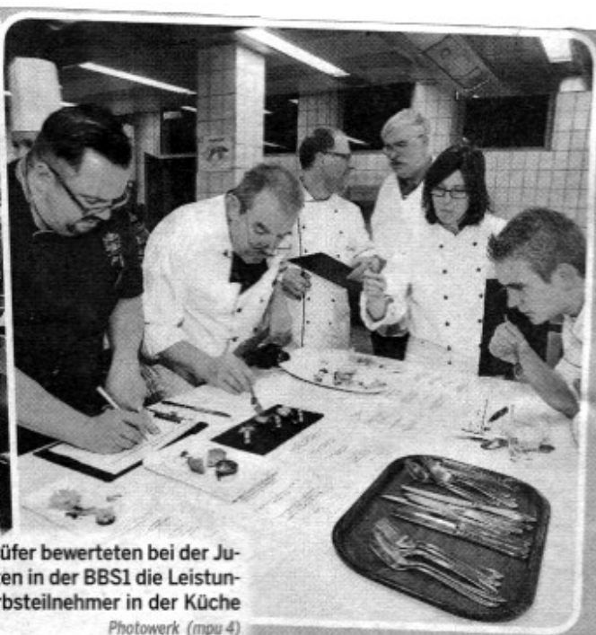
Photowerk (mpu 4)