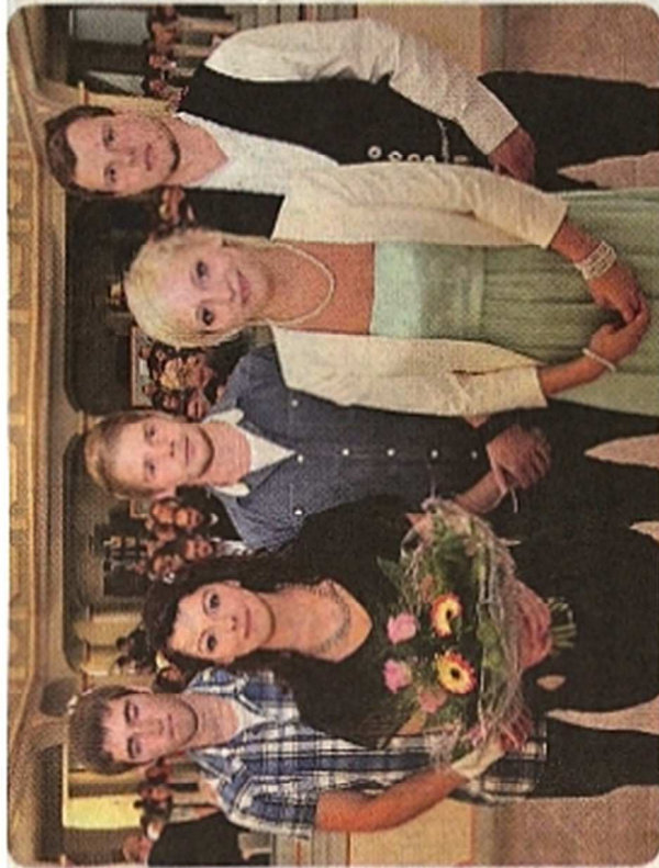
Tolle Leistungen gezeigt: Die Besten der Innungen wurden bei der Freisprechungsfeier mit Urkunden und Preisen geehrt.